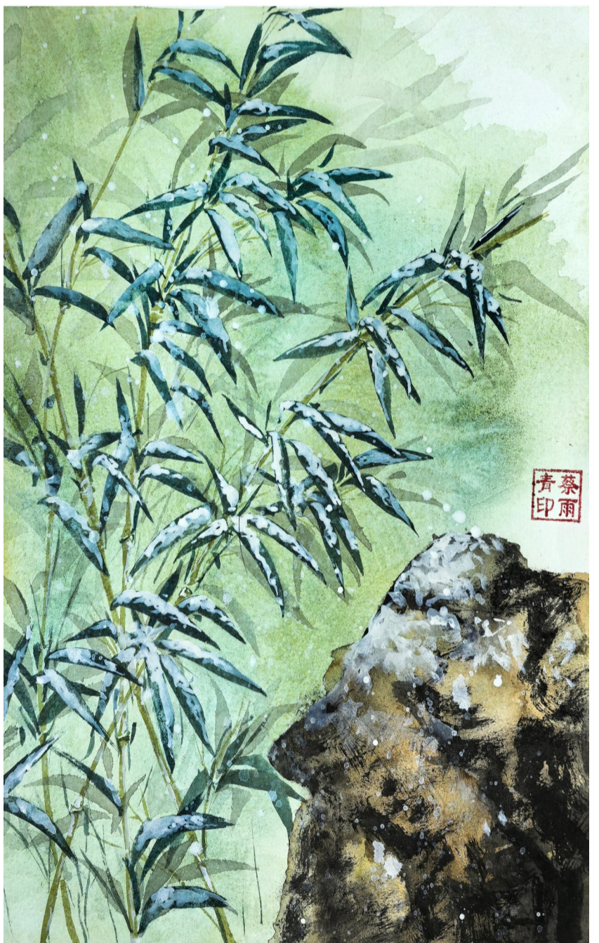
雪竹 水电十四局 蔡雨青 画