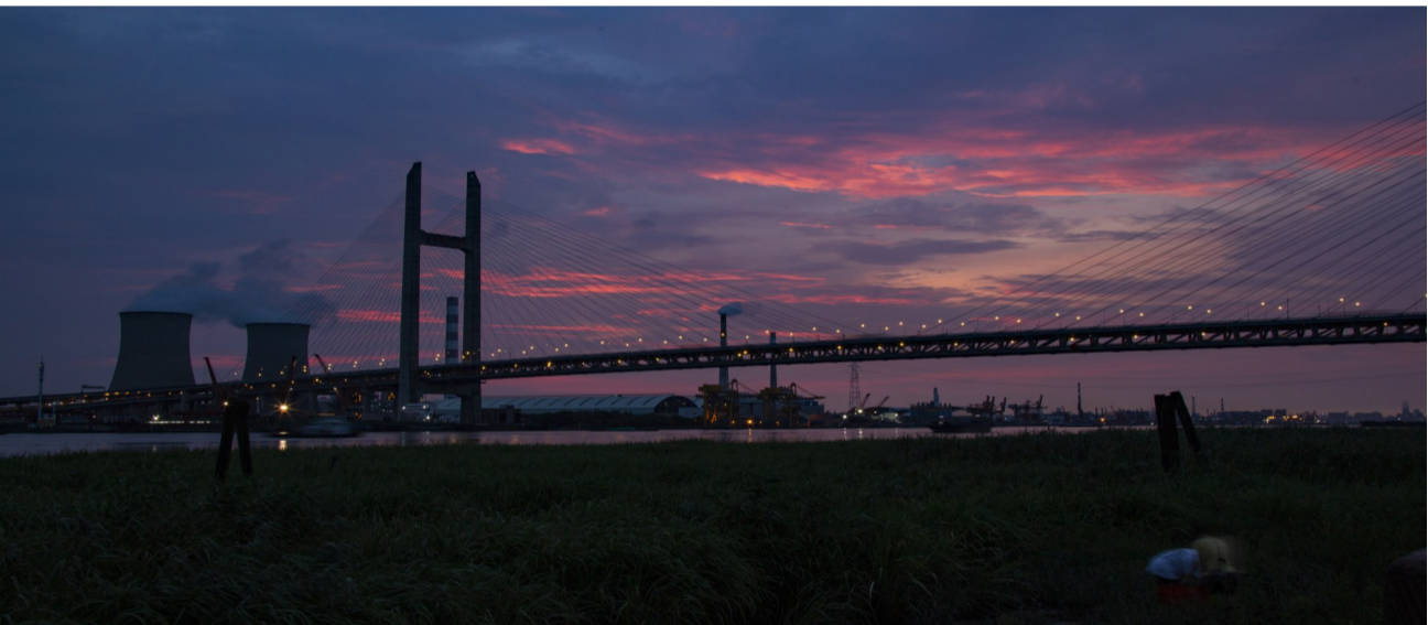
霞映长桥