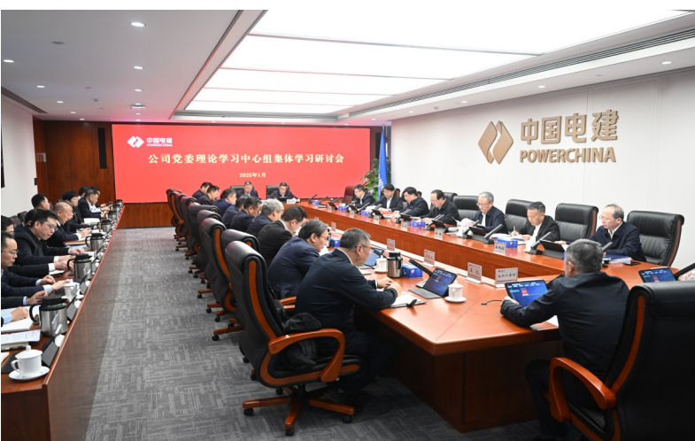
▲中国电建党委召开理论学习中心组集体学习研讨会