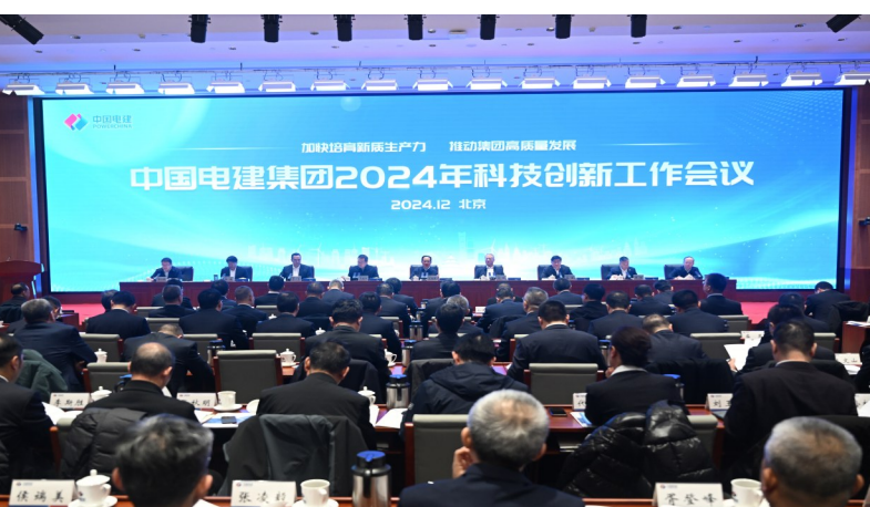
▲中国电建召开2024年科技创新工作会议