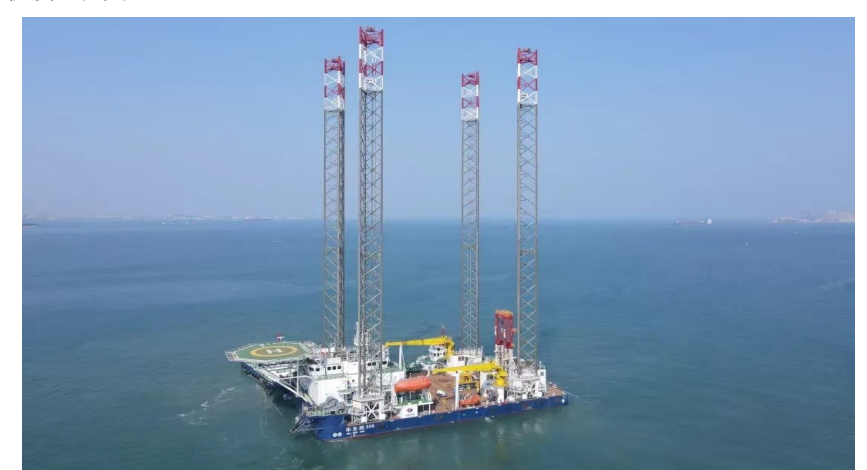
▲自主研发的海上综合勘探平台“华东院308号”

中国电建以国家战略需求为导向，强化科技创新主体地位，高水平筹建国家创新中心和海外研发平台，高标准构建科技成果转化和产业协同体系，为公司高质量发展贡献新力量、注入新动能。获批牵头组建中央企业BIM软件创新联合体，8月2日，在京召开中央企业BIM软件创新联合体启动大会暨第二届BIM成果应用大会。获批国务院国资委第二批“重点支持”水能领域原创技术策源地，8月21日，主持召开流域梯级清洁能源开发原创技术策源地启动会。牵头主持国家重点研发计划6项、国家自然科学基金项目6项。圆满完成国务院国资委第二批“1025专项”任务攻关，10项产品获省部级首套认定，自主创新迈出坚实步伐。入围国务院国资委建筑业类央企绿色低碳发展评价试点单位，碳资产收益显著。2名个人、1个团队荣获“国家卓越工程师”“国家卓越工程师团队”，1人获全国“杰出工程师奖”，8人入选国家科技人才计划，9人获国务院政府特殊津贴。荣获2项国家科学技术进步奖、2项中国专利奖、6项中国土木工程詹天佑奖、18项国家优质工程金奖、37项国家优质工程奖。