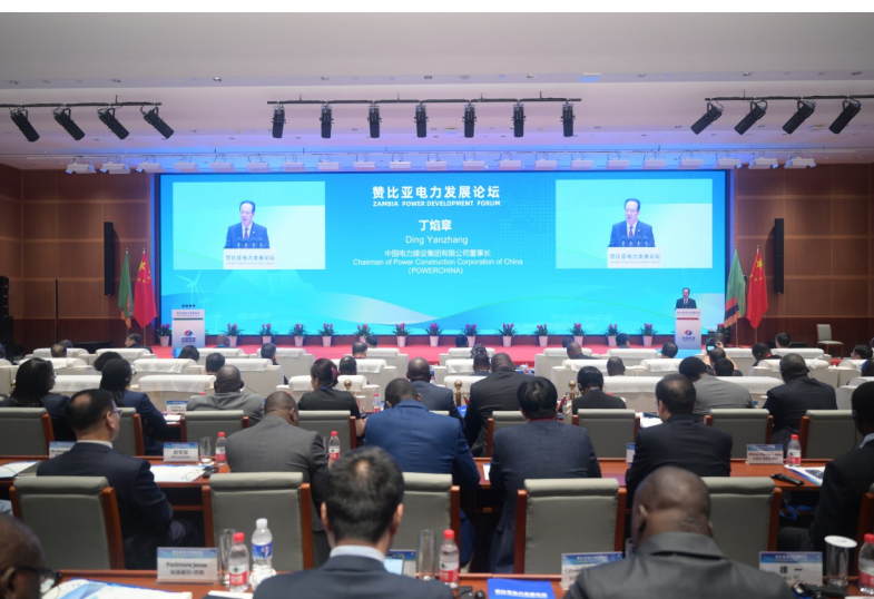
▲中国电建承办的赞比亚电力发展论坛在京举行揭牌