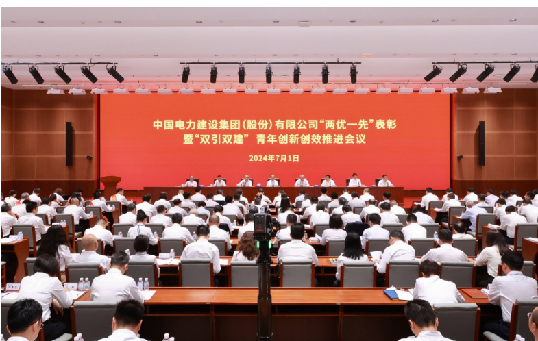
▲中国电建召开“两优一先”表彰暨“双引双建”青年创新创优推进会