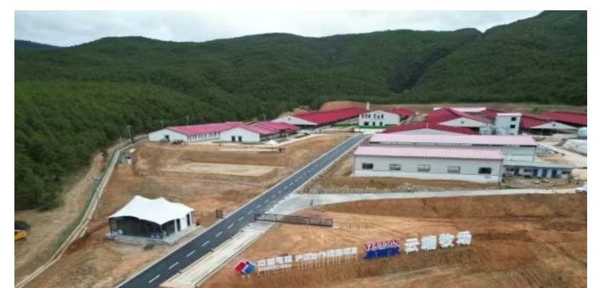
▲中国电建援建的云南剑川县万头奶牛云端牧场（二期）投产