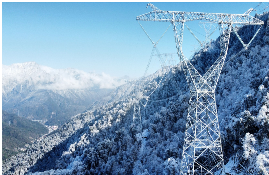
铁塔映雪