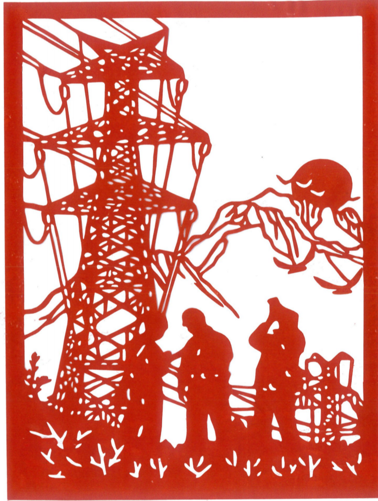
匠心筑梦 水电十四局 罗加巧 作