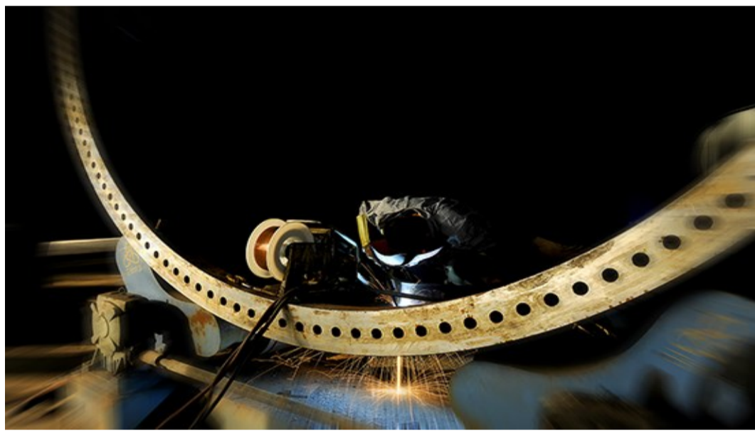
神工意匠