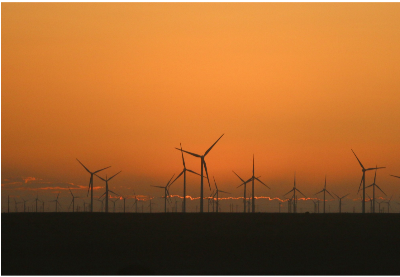
转动的希望