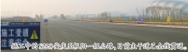
施工中的S228安庆至枞阳一级公路,目前主干道已全线贯通。

1月8日,安庆市委书记虞爱华等领导第三次来到S228安庆至枞阳工程项目考察,对安徽公司提前实现主干道通车目标表示满意,并勉励他们再接再厉,为安徽人民多作贡献。